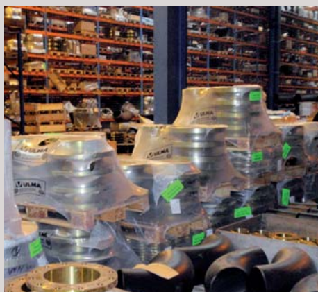
Skladové hospodářství Warehouse