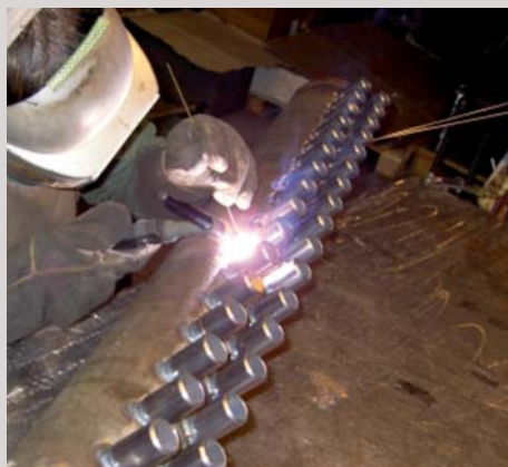
Výstavba teplárny Tábor, ČR Dodávka vysokotlaké komory Construction of heating plant Tabor, Czech Republic Supply of high pressure chamber