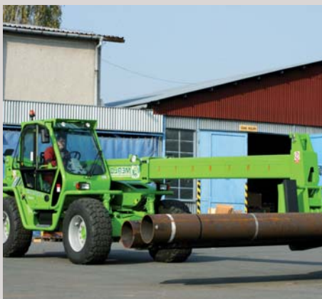
Skladové hospodářství Warehouse