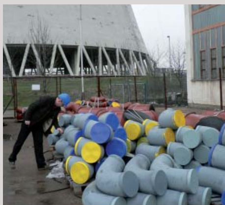
Komplexní obnova Elektrárny Tušimice, ČR Dodávky trubek, svařenců a tvarovek Complex reconstruction of power plant Tušimice, Czech Republic Complex supply of pipes, weldment and fittings