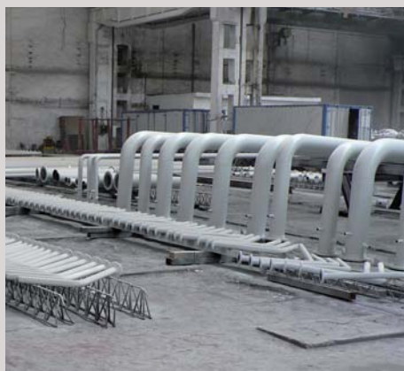
Výstavba rafinerie Kirishi, Rusko Prefabrikace potrubí Reconstruction of hydrocrack unit Kirishi, Russia Prefabrication of pipeline