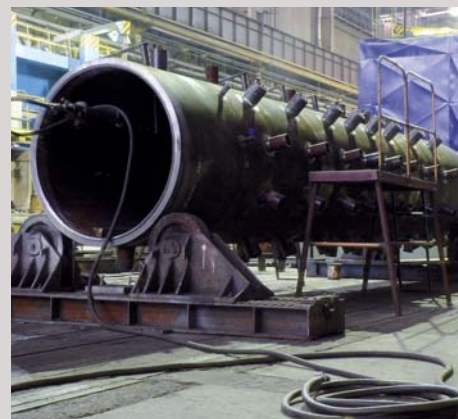
Výstavba teplárny Plzeň, ČR Dodávka bubnu - kotel K7 Construction of heating plant Plzen, Czech Republic Supply of boiler's K7 cylinder