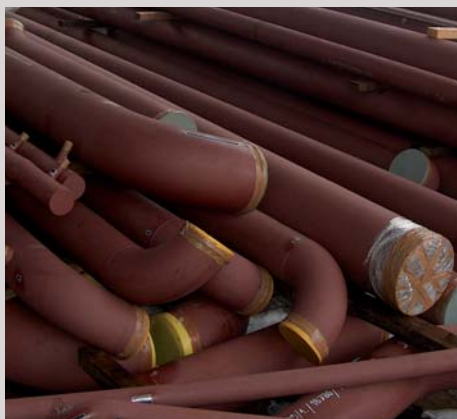
Elektrárna ALCHEVSK, Ukrajina Dodávka prefabrikace potrubí Power plant ALCHEVSK, Ukraine Supply of the pipeline prefabrication