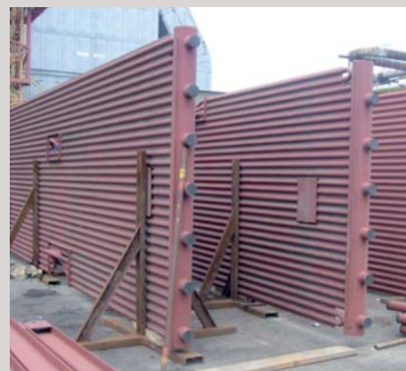
Výstavba teplárny Chomutov, ČR Dodávka membránové stěny Construction of heating plant Chomutov, Czech Republic Supply of membrane panels