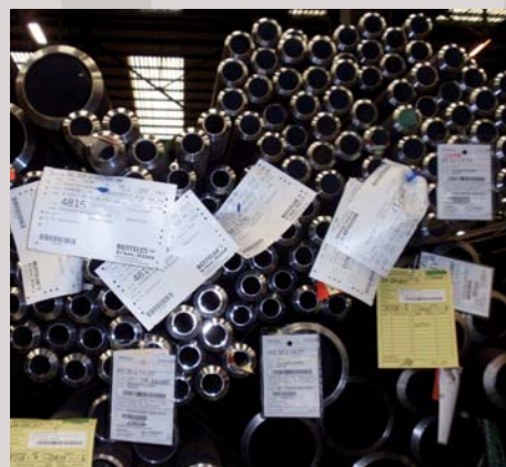
Skladové hospodářství Warehouse