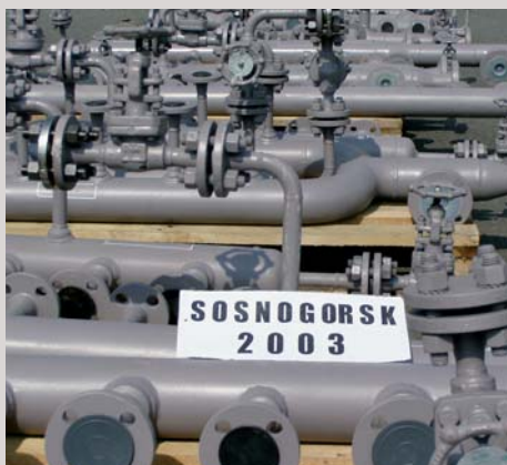
Rekonstrukce a výstavba plynostanice Sosnogorsk, Rusko / Dodávka tlakového sběrače a rozdělovače Reconstruction and construction of gas station Sosnogorsk, Russia Supply of pressure manifolds and collectors