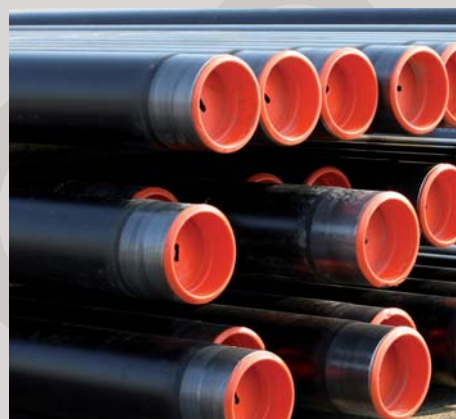
Výstavba rafinerie INA Rijeka, Chorvatsko Dodávka izolovaného potrubí Construction of hydrocrack unit INA Rijeka Refinery, Croatia Supply of insulated pipes