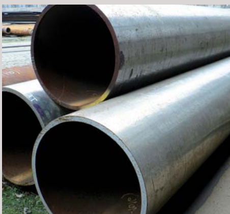
Generální dodavatel potrubních celků pro elektrárnu Balloki 225 MW CCPP, Pákistán Dodávka silnostěnných trubek P91 General supplier of the pipeline for the gas power station Balloki 225 MW CCPP, Pakistan Supply of heavy wall thickness pipes P91